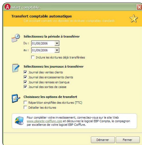
A Transférez vos données en comptabilité sans aucune ressaisie