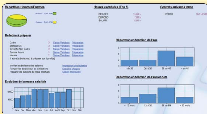
Le tableau de bord donne une vision globale de la situation salariale de l'entreprise